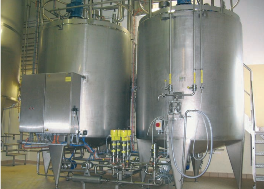
► Lagerung und Dosierung von viskosen Produkten