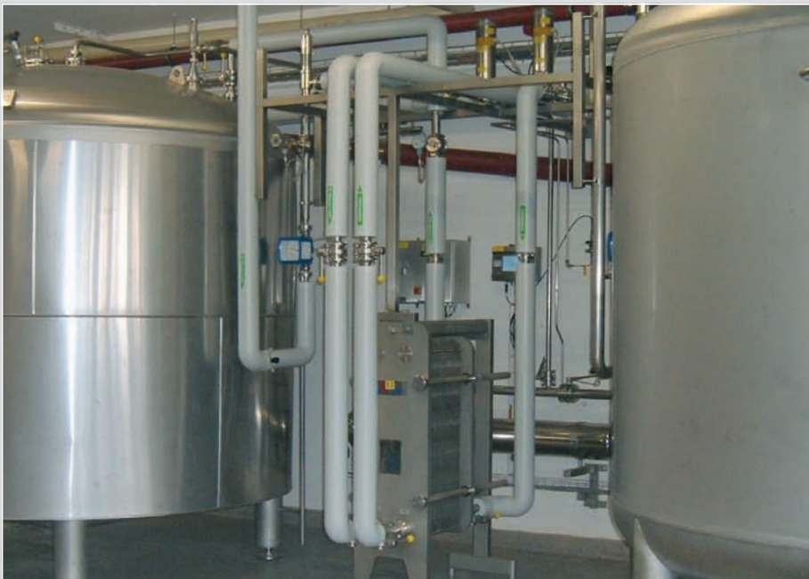
► VE-Wasser , Lagerung und Verteilung, Ozonisierung und UV-Behandlung