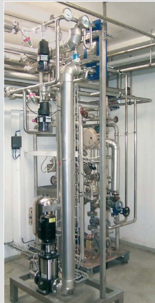
► Heißwassererzeugung , prozessabhängige Temperatur- regelung, Unitmontage